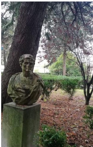
Bovino: Giardino delle Statue