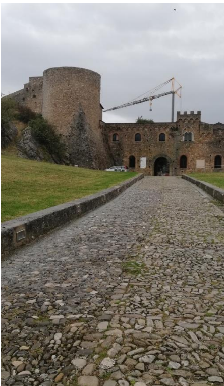
Bovino: Castello Ducale

Mi ha colpito la mole imponente del Castello Ducale , un altro importante elemento storico di questo piccolo borgo, che ha svelato un po' alla volta i suoi tesori.