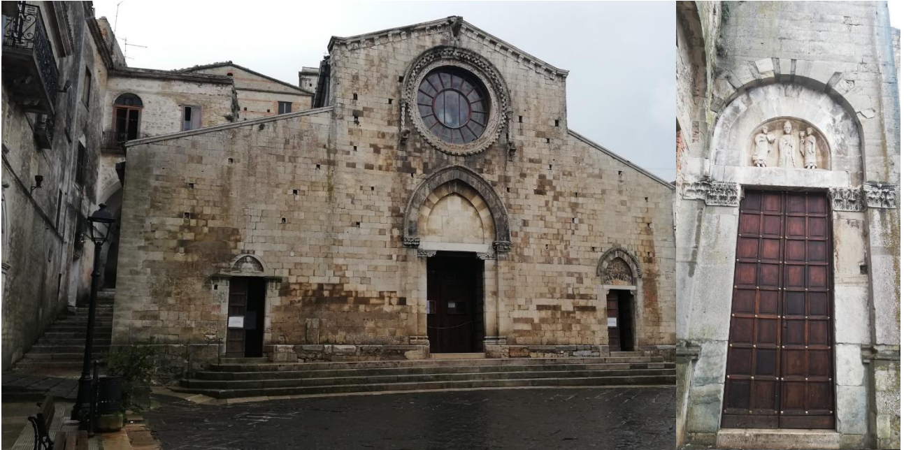
Bovino: Basilica Concattedrale di Santa Maria Assunta (facciata e particolare)

È seguito poi l'ingresso nella maestosa Basilica Concattedrale di Santa Maria Assunta , in cui si fondono elementi architettonici del romanico-pugliese e gotico-bizantini. Questi ultimi hanno risvegliato nel mio cuore di cristiana ortodossa dolci ricordi lontani.