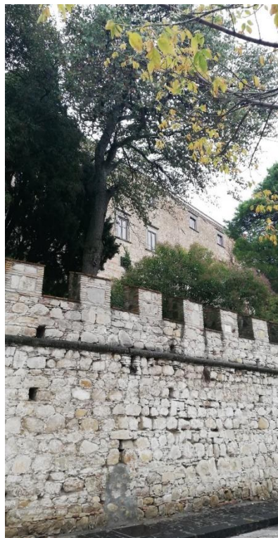
Particolare delle mura merlate