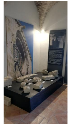
Bovino: Museo Civico (a destra una delle sezioni)